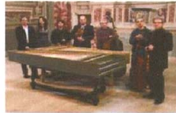
Orchestre Astrée de Turin